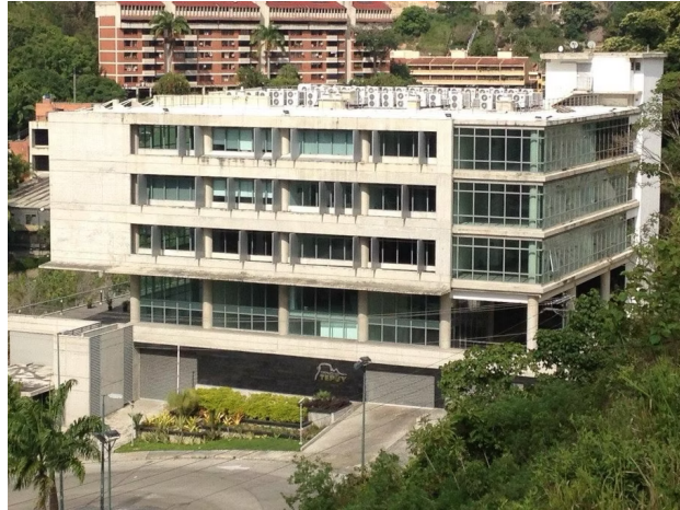
Centro Comercial Trinidad Tepuy